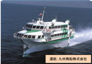
運航: 九州商船株式会社