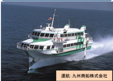
運航:九州商船株式会社